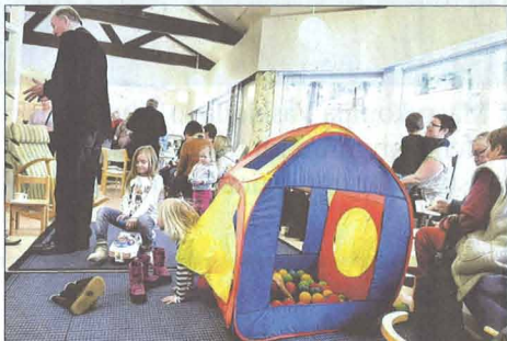
Särkisalokodissa näytti eilen siltä, mihin Yhres etteskäsi -hankkeessa on koko ajan tähdätty. Suurin osa kalusteista on saatu lahjoituksena.