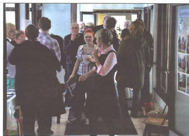
Käytävillä oli ruuhkaa.

Kaupungin toimesta korjataan tänä vuonna talon vesikattoa ja maalataan ulkoseiniä.